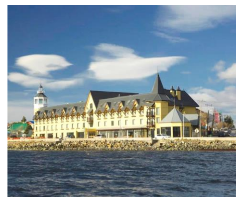
Costaustralis Hotel, Puerto Natales