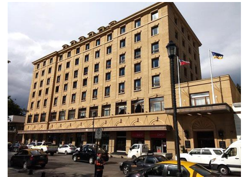
Cabo de Hornos Hotel, Punta Arenas