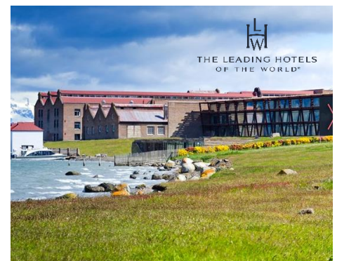
The Singular Patagonia, Puerto Natales