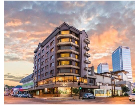
Don Luis Hotel, Puerto Montt

Lage: Zentral, direkt am Last Hope Fjord gelegen.