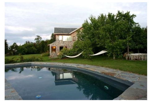
Los Caiquenes Boutiquehotel, Puerto Varas