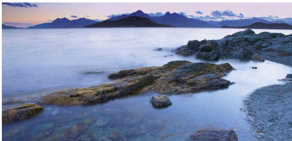
Der Beagle-Kanal in Ushuaia

Tag 4: Ushuaia – Flughafen Frühstück im Hotel und Transfer zum Flughafen.