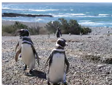
Trelew: Magellan-Pinguine am Strand von Punta Tombo

Ganztagesausflug zur Peninsula Valdés. Fachkundige Erklärungen über die geologischen Besonderheiten dieser Gegend sowie über die reiche Flora und Fauna werden den Ausflug bereichern. Die