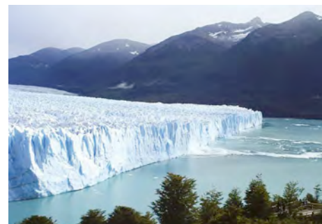
El Calafate/Lago Argentino: Perito Moreno-Gletscher

Ganztagesausflug nach Punta Tombo. Man durchquert ein Steppengebiet, wo man auf Nandus (Familie der Strausse), Maras (Patagonischer Hase), Guanacos (aus der Familie der Lamas) etc. treffen kann. In Punta Tombo findet man die weltberühmten Magellan-Pinguine. Sie stehen unter Artenschutz und man kann sie vor allem in den Monaten September bis März – aus nächster Entfernung, gut beobachten. Mittagessen.