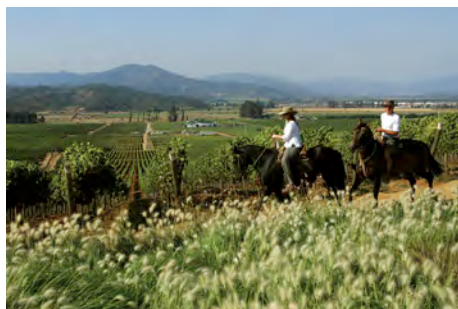
An der Rota del vinos

Frühmorgens Ankunft in Buenos Aires. Nachmittags: Sie besuchen den «Plaza de Mayo», das rosarote Regierungsgebäude, die Kathedrale, das «Teatro Colon», den Obelisken und die pittoresken Stadtviertel von La Boca, San Telmo und Recoleta. Spezielles Begrüssungabendessen im Restaurant «Las Nazarenas».