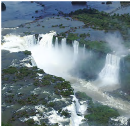
Iguassu: Die Wasserfälle von oben

Tag 16, Montag: El Calafate – Buenos Aires Gegen Mittag Flug nach Buenos Aires. Rest des Tages zur freien Verfügung.