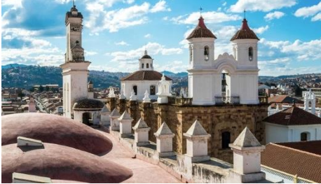
Sucre, die Weisse Stadt

Sucre, die konstitutionelle Hauptstadt von Bolivien und Sitz des obersten Gerichtshofs, liegt im zentralen Südtteil des Landes und ist Hauptstadt des Departamento Chuquisaca. Die Stadt ist seit 1839 nach dem revolutionären Führer Antonio José de Sucre benannt. Sie ist heutzutage für ihre Schokoladen-Spezialitäten bekannt.